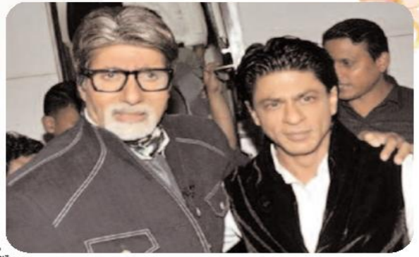
هذا الجزء الجديد، الذي يقدمه رانفير كطلا أصيبت بموهبته وتعدد أدواره. تمنى أن ينال الحب الذي حظي به باتشان وشاروخان. وكشفت "Pinkvilla" أيضا حبريا أن دعاية "3 Don" ستأخذ بأهديات اعتبارا من 11 أوت، وقد تم الإعلان عن أن الفيلم من المقرر طرحه في دور السينما في 2025. ودون... عودة الملك هو فيلم هندي من إخراج فرحان أختار صدر عام 2011 من بطولة شاه رخ خان وبريانكا شوبرا، بومان إيراني وكول كاپور، ويعد الفيلم الجزء الثاني لتيلم (دون) المعاصرة لتبدأ مرة أخرى سنة (2006) لتلش المخرج.

حقق المخرج الهندي فرحان أختار، أخيرا رغبة المعجبين بإعلانه عن الجزء الثالثة من سلسلة "Don". ورغم إعلانه عن الجزء الجديد من السلسلة إلا أنه أعلن أكبر تغيير وهو أن نجم بوليوود شاروخان لن يقوم بإعادة تأدية دوره بالقبلم. ووفقا لموقع "Pinkvilla" الذي أعلن من قبل أن الممثل رانفير سينغ سيستبد السلسلة الشهيرة. الآن، أعلن فرحان رسميا أن رانفير هو الوجه الجديد لـ "Don". وقام ستانغ فيلم "3 Don" بمن فيهم المخرج فرحان أختار والممثل ريتيش سيدواني بنشر أول فيديو للإعلان عن الفيلم، معناه أن الجزء الثالث من السلسلة قيد الإصدار. شارك مقطع فيديو أظهر رقم 3 "بداية عهد جديد". وكتب فرحان أيضا ملاحظة طويلة عن تكملة السلسلة التي قدمها من قبل أميتاب باتشان وشاروخان كتخصيصة دون. وعبر أختار عن أمثله أن يحصل الممثل على الكثير من الحب من المشاهدين. قال: "لقد حان الوقت الآن لأخذ إرث السلسلة إلى الأمام والانضمام إليها في عام 2025".