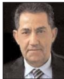
■ بقلم: عبد الحميد صيام