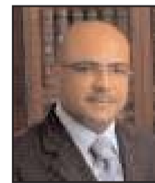
■ بقلم: ياسر بكر الغزوي

عليك ألا تستهجن في أزمنة الرداءة تسبب التافهين وركوبهم سنام المشهد. وعليك ألا تستكثر عدد المصنفين لهم، وحشود المسيحين بسطوتهم، وزرافات الماشين في مساربهم. عليك ألا تسأل عن وضعهم في مكانتهم هذه. فهي ليست لهم، ثم وهذا المهم، عليك ألا تتفاجأ بأنهم فارغون سطحيون، لا ثقافة ولا