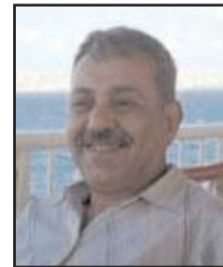
■ بقلم: ياسر بكر صدقي

يبدو عالم اليوم، لجيلنا الذي تشكل وعيه في حقبة الحرب الباردة، غارقاً في اضطرابات نجد صعوبة في فهمها، ناهيك عن التفكير في مخارج محتملة لها. فلم يعد العالم منقسماً، كما في تلك الحقبة، بين قوتين دوليتين رئيسيتين تخوضان صراعاً على النفوذ بغطاء أيديولوجي يقدم نموذجين يستهوي كل منهما قوى اجتماعية مختلفة، فيتناسل ذلك الصراع إلى صراعات موضعية، أو حروباً وحروباً أهلية بالوكالة عن القوتين المشار إليهما.