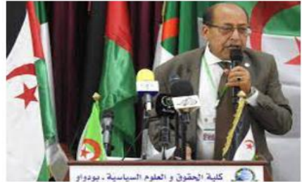
كلية الحقوق والعلوم السياسية، بيودور

و سرد السيد محمد لفظف عوة كرونولوجيا لأهم مراحل الانتفاضة في الصحراء الغربية المحتلة، بدءا من إنتفاضة الزملة التاريخية وصولاً إلى إنتفاضة الإستقلال العام 2005، و التي إرتبطت جميعها بأحداث معينة كعبئة تقصي الحقائق التي شكلت شرارة لإنتفاضة 1975، و كلت والرسالة أن جبهة البوليساريو هي الممثل الشرعي والوحيد للشعب الصحراوي، مظاهرات