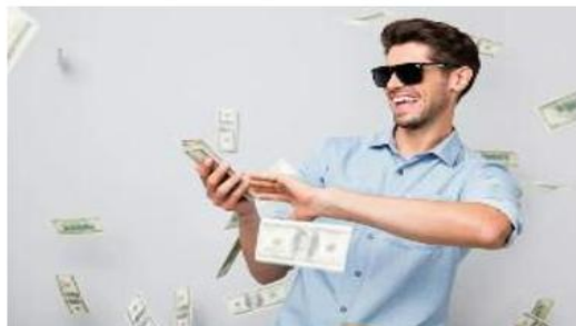
هذا ما حصل مع مواطن أمريكي من ولاية فلوريدا، حيث فاز بالجائزة الكبرى في اليانصيب والبالغة 1.58 مليار دولار ليل الثلاثاء، منيها فرة من عدم الفوز بأي من أوراق اليانصيب امتدت لا يقرب من 4 أشهر. في التفاصيل باع متجر بقالة على شاطئ نيوون الذكرة الفائز،

وفق منظمة اليانصيب. وقبل الفوز الكبير ليل أمس، جرى 31 سحباً متتالياً منذ آخر مرة فاز فيها أحدهم باليانصيب في 18 أبريل، ليتم مبلغ الجائزة بشكل متدرج لتصلح ثالث أكبر جائزة على الإطلاق في تاريخ الولايات المتحدة، حسب أسوشيتد برس. يشير إلى أنه يمكن للفائز، الذي لم تُحدد هويته بعد، اختيار الحصول على حوالي 783 مليون دولار نقداً دفعة واحدة، أو استلام المبلغ الكامل مقسماً إلى مدفوعات سنوية على مدى 30 عاماً تزيد قيمتها بنسبة 5٪ سنوياً. فيما يختار معظم الفائزين الحصول على الجائزة دفعة واحدة. وتوضح جميع الكاسبات لضرائب الدخل، وفق فرانس برس. الجدير بالذكر أن احتمالات الفوز بالجائزة الكبرى في «معا مليون» تبلغ واحداً من 303 ملايين، وهي نسبة أدنى بكثير من احتمال العرض لصاغة البالغ واحداً في المليون، بحسب بيانات الحكومة الأمريكية.