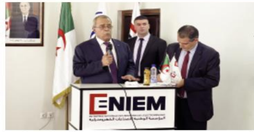
أعلن وزير الصناعة والإنتاج وزو في إطار زيارة عمل، أن فتح رأسمال السيدلاني، علي عون، الأربعاء بتيزي المؤسسة الوطنية للصناعات

الكهرومنزلية، لشراكة وطنية أو أجنبية "ضرورية لإنقاذ المؤسسة". وأكد الوزير في تصريح للصحافة عقب لقاء مع مسؤولي الشركة وممثلي العمال بمقر وحدة الإنتاج للمؤسسة الوطنية للصناعات الكهرومنزلية بواد عيسى، أن "الدولة لن تتخلى عن المؤسسة" وإن تكون هناك خصوصية لها. متحدثاً عن "إمكانية إدراج شراكات" لإنقاذها. وأوضح عون أن "خيار فتح رأسمال المؤسسة الوطنية للصناعات الكهرومنزلية للشراكة بقرره مسؤولياً"، معتبراً من "الضروري وضع برنامج عمل فعال" من أجل تجاوز الصعوبات التي تواجه الوحدة بولاية