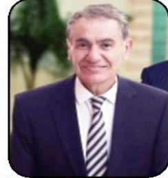
لقلم: جلال محمد حسين نشوان

الامر الذي يحتم على الأمتين العربية والإسلامية البقطة والارتقاء إلى مستوى التحديات، وكالات الإعلام العالمية ومن بينها وكالة (سي إن إن) الأمريكية بدأت تتحدث مؤخرا عن ظهور بقرة حمراء في ولاية تكساس، وتلقت وسائل الإعلام الصهيونية هذه الرواية، وبدأ الحديث عن إمكانية نقل البقرة إلى دولة الاحتلال عندما تبلغ 3 أعوام، وعندها يصبح الوقت قد حان حسب المعتقادات اليهودية لهدم المسجد الأقصى. إلا أنه للافت للنظر أن تحقيقا مسبقا كشف أن عدة وزارات حكومية تخصص موارد مالية طائلة لتنفيذ مشروع يهدف لبناء معبد يهودي ثالث في المسجد الأقصى، ويزعم مروجو المشروع، بمن فيهم الإحاطة إسرائيل أرييل من حركة "كاخ" العنصرية أن هذا الإجراء سيسمح بشرعية ما وضعا بالهجرة الجماعية للمستوطنين اليهود إلى المسجد الأقصى، تتناثر الوعود الكاذبة بأن دولة الاحتلال لن تصيح دولة شرعية، ومع ذلك تجري عمليات على السطح قد تغير الصورة بالكامل، ففي الأونة الأخيرة، وبالتعاون مع الوزارات الحكومية، تبذل العديد من الجهود لتثبيت رؤية غيبية من وقت تدمير الهيكل الثاني، بموجبها فإن حرق بقرة حمراء سيمنع من وصول ملايين اليهود إلى المسجد الأقصى، وإقامة الهيكل الثالث على أنقاضه، ويعلم مؤيدو تحقيق هذه الرؤية الغيبية أمالهم على خمس بقرات حمراء تم إحضارها إلى دولة الاحتلال بالطائرة من ولاية تكساس الأمريكية، وتم اختيارها بعناية، وأن من يقفون وراء البحث الجموم لتحديد مكان البقرة