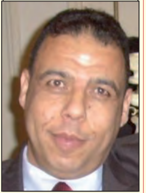
د. العاصي /باحث وكاتب

عبر التاريخ، وعلى امتداد العصور، ظهر صراعا جديليا بين العقل الديني والعقل الفلسفي. هذا الجدال والتناحر بين الفلسفة والدين أسهم في رقي الحضارة العربية والإسلامية، وبلوغها العصر الذهبي، حيث كان لبعض الخلفاء والولاة دوراً مهماً في رعاية الفكر والفلسفة والعلوم والآداب. كان هؤلاء يعقدون المجالس العلمية للنقاش والسجال الفكري والفلسفي والديني، في فترة شكلت الحضارة الإسلامية شعاعاً علمياً وفكرياً لكافة البشرية.