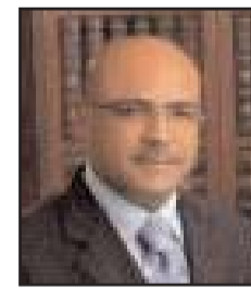
■ بقلم: رمزي الغزوي

بعد أن رفّصتي الدهشة وأنا أطلع الصور الجديدة المبتوثة من عيون التلسكوب «جيمس ويب»، ضريني سؤال البشرية الأزلي، فيما إن كنا نحن الكائنات الذكية الوحيدة في هذا الكون الممتد المتمدّد. والجواب، وإن كان سيتوتش طبقة من البهجة، إلا أنه قد يكون مرعباً في الاحتمالين. مرعب إن كنا وحدنا، وأكثر رعباً إن كان ثمة من يقعون على كوكب ما، ولم يتواصلوا معنا حتى الآن، أو حتى لم يقلوا أن يتلقوا رسائلنا المزجاة لهم بالسلام منذ زمن بعيد.