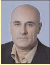
■ بقلم: محمد سلامة

قادة الائتلاف الحاكم في إسرائيل الثالثة يحذرون المحكمة العليا من نقض قانون عدم المعقولية، والنساء اليهوديات يقبلن على شراء الأسلحة، وثلاث ميليشيات مسلحة باتت حاضرة بقوة إلى جانب الجيش والأجهزة الأمنية، وتسويات بتهديد السلاح في النقب، وتنتيهاو السادس يتحدث عن الخطوة القادمة لضعاف القضاء وأحكام اليمين المتطرف السيطرة.. فالخوف يستوطن قلوب الصهاينة في دولة تل أبيب وضواحيها وفي دولة المستوطنين وحلفائهما. (150) الف مسلح يتبعون قيادات صف أول يمينية لابن غفير وسموتريتش، وقيادات صف ثاني في الأحزاب اليمينية المتشددة، من الحريدديم، وهؤلاء يقبسون بغالبيتهم في مستعمرات الضفة الغربية وفي ضواحي المدن الإسرائيلية، وبلا عمل، ويحصلون على الأموال من موازنة الدولة الإسرائيلية كونهم حماة التوراة، وينشرون الخوف بين اليهود الاشكناز في مراكز المدن الإسرائيلية، وفي الأرياف الفلسطينية وفي الطرقات والشوارع، وأحياناً يقبسون حواجز مسلحة يباشرون من خلالها التدقيق في حركات وتقلبات الاغيار، ويمارسون القتل دون مبرر، ولا يجرؤ الجيش الإسرائيلي على التدخل كما أن الشرطة الإسرائيلية وكافة الأجهزة الأمنية تخشى التعامل معها في أي مشكلة داخلية أو في الضفة الغربية.