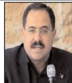
■ بقلم: صبري سيدم

طال أمد الحرب الروسية الأوكرانية بصورة تجاوزت توقعات المحللين، فقد مرّ زمن طويل منذ أن عبرت القوات الروسية الحدود باتجاه كييف في فيفري من العام الماضي، في ما بدا للوهلة الأولى بأننا أمام نصر سريع. فموسكو لم تدخل المعركة بارتجال، وإنما خطط لها بكامل تفاصيلها في مشهد تقول موسكو بأن الغرب قد فرضه عليها، خاصة مع تشجيعه لكييف للتقرب أكثر من دول حلف شمال الأطلسي، ودعوة أوكرانيا أيضاً للانضمام للحلف، والسماح بنشر صواريخ طويلة المدى قادرة على دك موسكو. حال لم يرق لموسكو فافتتعت بضرورة أن تعد العدة لحرب ضروس ضد أوكرانيا، خاصة بعد تراكم معطيات كبيرة وتاريخ حافل بالندية والنزاع.