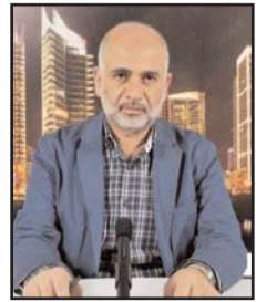
■ بقلم: مصطفى يوسف اللدوي

لم تبق وسيلة لمواجهة الشعب الفلسطيني وقمع انتفاضته، وإخماد مقاومته وإسكات صوته، وتشتيت صفه واضعاف كلمته، وحرف مقاومته وتشويه صورته، وإخضاعه وكي وعيه، وتركيبه وكسر إرادته، وغير ذلك من الوسائل المكشوفة والخفية، والمباشرة والمتوتية، التي يتفقت عنها ذهن الجلادين ويبتدعها عقل العتاة المجرمين، إلا لجأ إليها الاحتلال الإسرائيلي واستخدمها، واعتمدها سياسة واتخذها منهجاً، ظاناً أنه يستطيع بها أن ينهي مقاومة الشعب الفلسطيني، وأن يتخلص من عناده وثباته، وأن ينهي وجوده ويحارب بقاءه، وأن يمرر على الفلسطينيين عموماً سياساته ونظرياته، ويسلبهم حقوقهم ويطردهم من أرضهم، ويجتث من عمق الأرض جذورهم، فلا يبقى لهم فيها اسماً ولا في قلبها أثراً، ولا تعود عندهم قوة يقاومون بها ولا وجود لهم فيها يشجع مقاومتهم ويعزز مكانتهم ويقوي موقفهم، أو يهدد أمن وسلامة مستوطنيتهم، ويعرض كيانهم للخطر ومصالحهم للضرر.