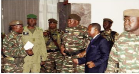
الانقلابيين في النيجر أسبوعا لإعادة الرئيس محمد بازوم إلى منصبه، علما بأنه لا يزال محتجزا. وأعاد مصدر الجوار يبيتى أولوية.

أبلغ المجلس العسكري في النيجر الجماعة الاقتصادية لدول غرب إفريقيا التي كانت تريد إرسال وفد إلى نيامي، بأنه لا يستطيع المجيء في الوقت الحالي لأسباب "أمنية".