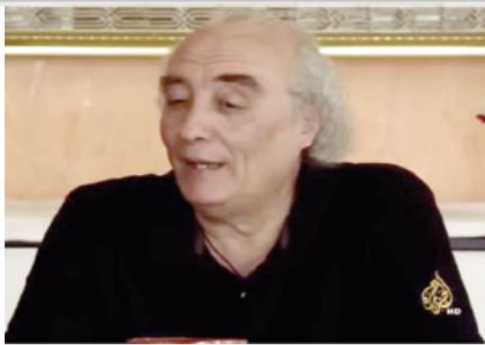
الروائي والأكاديمي والجزائري واسيني الأعرج يتحدث في لقاء صحفي.

أهواء أو أفكار... هي مسائل مهمة جدا، وهي جزء من كياننا الجباني والإنساني، وبالتالي، فالكتابة الأدبية حتما ستنتج بهذا الطابع، وهذا الطابع أنا عشتته وربما غيري عاشته عبر حالات أخرى، ولكن كان لي اهتمام واسع في هذا الجانب، وذلك يعطي نوعا من التمايز، ولكن التمايز الأساسي ليس في هذا وحده، فربما يكون في الموضوعات وفي الجهد الذي تبذره أنت بوصفك كاتباً لكي تجعل من هذه المادة الحياتية مادة أدبية.