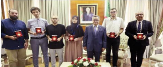
طلبة للدراسة، في أول مشاركة لهم، وبهذه المناسبة منح الوزير الطلبة وأساتذتهم "وسام الاستحقاق للوزارة". نظير مشاركة الطلبة الجزائريين المتوجين في المسابقة الدولية للرياضيات (بلغاريا)، حسب ما أفاد به الثلاثاء بيان للوزارة.

كرم وزير التعليم العالي والبحث العلمي، كمال بداري، الطلبة الجزائريين المتوجين في المسابقة الدولية للرياضيات إختلاف الجامعات، التي أقيمت مؤخرا بمدينة بلاهوغراد (بلغاريا)، حسب ما أفاد به الثلاثاء بيان للوزارة.