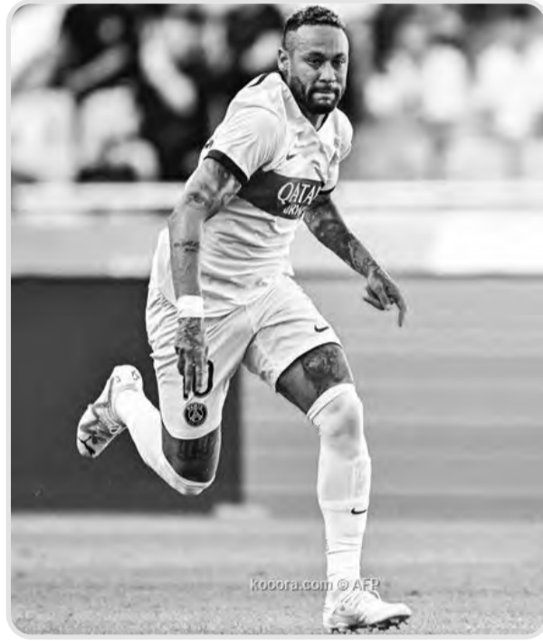
وصول "actu foot" وأتبع هذه "الرقصة الأخيرة" مع صورة لنيمار المعلومات بتفريغ أخرى كتبت فيها بقميص برشلونة، في إشارة منها إلى

يرتقب أن يشهد الميركاتو الصيفي الحالي مفاجأة من العيار الثقيل بعودة نيمار جونسون نجم باريس سان جيرمان الفرنسي، إلى نادي السابق برشلونة في سيناريو عكسي، وذلك بعد اتخاذ الدولي البرازيلي خطوة هامة تقربه أكثر من أي وقت مضى من النادي الكاتالوني، وفق ما أشارت إليه تقارير إعلامية موثوقة.