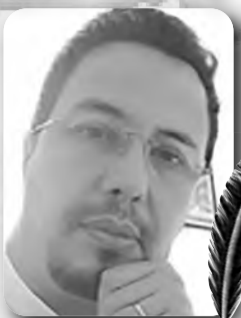
بقلم: حسان زهار