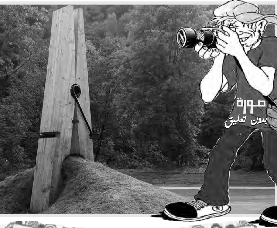
صورة بدون تعليق

تنظم وزارة الشؤون الإسلامية السعودية، الأحد المقبل، المؤتمر الدولي "التواصل مع إدارات الشؤون الدينية والإفتاء والمشيخات في العالم" تواصل دولته يمثلها وزراء ورؤساء الشؤون الدينية والإفتاء والمشيخات والجمعيات الإسلامية. تنظيم هذا المؤتمر يهدف إلى تعزيز روابط التواصل والتكامل بين إدارات الشؤون الدينية والإفتاء والمشيخات في العالم، وتحقيق مبادئ الوسطية والاعتدال وتعزيز قيم التسامح والتعايش بين الشعوب، وإبراز دورها في التأكيد على ضرورة الاعتصام بالقرآن الكريم والسنة النبوية، وخدمة الإسلام والمسلمين، وتعزيز الوحدة الإسلامية بين المسلمين، ومحاربة الأفكار المتطرفة، وحماية المجتمعات من الإلحاد والانحلال، وأن تجربة المملكة تجربة فريدة في الدعوة إلى الله ونشر مبادئ الرحمة والحفاظ على القيم والمبادئ مع البناء والنهضة الوطن والتقدم في شتى المجالات لمجتمعاتهم. كما تنظم خلال جلسات هذا المؤتمر سبعة محاور رئيسية، الأول: جهود إدارات الشؤون الدينية والإفتاء والمشيخات في العالم في خدمة الإسلام والمسلمين وتعزيز الوحدة الإسلامية، والثاني: التواصل والتكامل بينها الواقع والمأمول، والمحور الثالث: جهودها في تعزيز قيم التسامح والتعايش بين الشعوب، والرابع: الاعتصام بالكتاب والسنة النبوية تأصيلاً وجاهداً، والخامس: الوسطية والاعتدال في الكتاب والسنة النبوية تأصيلاً وجاهداً، والسادس: جهود إدارات الشؤون الدينية والإفتاء والمشيخات في العالم وما في حكمها في مكافحة التطرف والإرهاب، والمحور السابع والأخير: جهودها في حماية المجتمع من الإلحاد والانحلال.