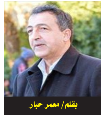
بقلم / معمر حيار

بيعة سيدنا الأمير عبد القادر، وحقد الأتراك: قال الكاتب: رفض والد سيدنا الأمير عبد القادر الإمارة، ورفض أن يوليها ابنه مدة ثلاث سنوات والعلماء،