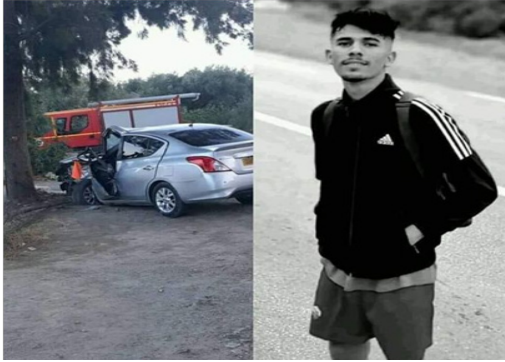
وفاة شاب 19 سنة كان يبيع التين الشوكي (الهندي) بجانب الطريق عند تفاجئه بسيارة كانت تسير بسرعة فائقة جدا وتصطدم به...