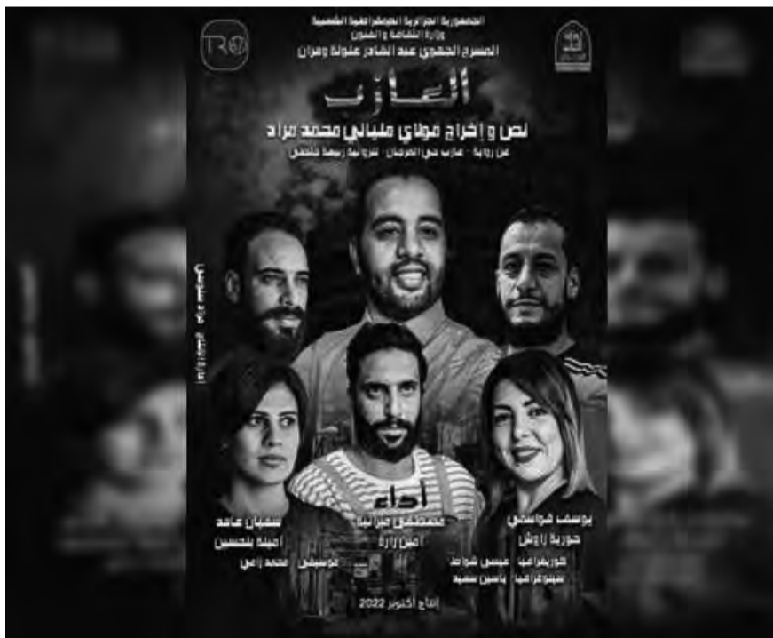
المسرح المتوسطي بتونس عرض مسرحية "العازب"

جويلية الماضي اتفاقية التعاون بين الهيئتين وسيتم خلال مهرجان