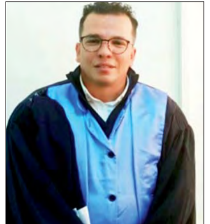
البروفيسور غزالي ناصر صلاح الدين جامعة تلمسان

تطوير استثماراتهم وبالتالي خلق مناصب عمل جديدة وزيادة الإنتاجية، بالرغم من الضرر التي قد يوفرها الاعتماد على التكنولوجيا المالية في القطاع المالي الجزائري، إلا أننا نجد محدودية في استخدام التطبيقات المالية الرقمية، ومختلف خدمات التكنولوجيا المالية، الأمر الذي كان له آثار سلبية على درجة وصول الخدمة، وتراجع حجم الادخار في الاقتصاد، وعدم تطور حجم التجارة الالكترونية، ومشكلة السيولة التي تشهدها المؤسسات المالية خاصة خلال المناسبات الدينية (الطوابير الكبيرة لسحب الأموال)، وعدم تمكن الحكومة من إيصال المساعدة والتحويلات المالية للعائلات والأطراف المتضررة من وضعية الإغلاق بفعل وباء كورونا بالشكل السريع والفعال، واللجوء إلى الحلول البدائية من أجل الوقاية من انتقال العدوى (تعميم النقود في المعاملات بالمحلات التجارية)، وهذا كله راجع إلى التحديات التي تحول دون الاعتماد الواسع على التكنولوجيا المالية في المنظومة المالية الجزائرية، حيث تعاني من ضعف البنية التحتية الرقمية ومشكلة