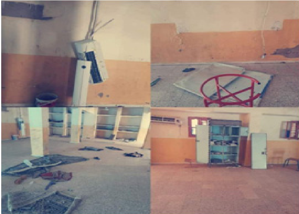
تعرضت المدرسة القرآنية التابعة للمسجد العتيق ببرج باجي مختار للتخريب من طرف مجهولين.