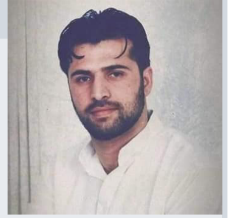
بقلم: الأسير : أسامة الأشقر