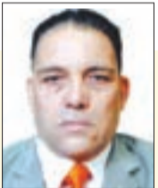
■ د / محمد بواروايح

يرى ملاحظون أن قرار روسيا تزويد بعض الدول الإفريقية بالحبوب مجانًا يعد من الناحية الأخلاقية قرارًا مهينًا لها، إذ أكد أداما غاي، الصحافي السنغالي والمتخصص في العلاقات الدولية أن "واردات القمح تطرح مشكلة إيديولوجية بالنسبة لإفريقيا لأنه ليس من المقبول أن تعتمد دول القارة الإفريقية على دول أخرى من أجل إطعام شعوبها وذلك بعد مرور سنتين عاما على استقلال غالبية هذه الدول". وأضاف أداما غاي: "في حال أرادت روسيا بناء شركات طويلة الأمد مع القارة السمراء، فعليها قبل كل شيء أن تدعم سيادتها الغذائية وتساعد على إنتاج الأسمدة والحبوب وبناء مصانع وتوفير العتاد الفلاحي الضروري لإنتاج المحاصيل".