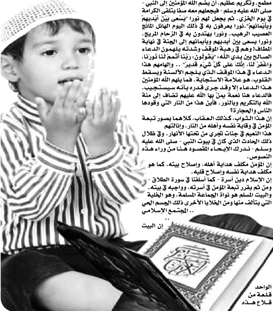
الواحد قلعة من قلاع هذه

قال ابن مسعود: "كونوا ينجب العلم مصابيح الظلام، جدد القلوب، خلصان الثياب، تعرفون في أهل السماء، وتخفون على أهل الأرض".