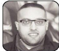
يقدم، هادي قدري أبو بكر

لم تكن علاقتي بوالدي الشهيد اللواء قدري أبو بكر يوماً من الأيام علاقة ابن بأبيه فحسب، بل كان لي أخاً وحبيباً وسديقاً.. كان لي قائداً ومعلماً وقوداً .. وكثيرون ما كانوا يستغربون طبيعة علاقتنا .. فهمنم من وصفها بالعلاقة "الوثنية"، وهمنم من شخصها "التعلق المرضي" ! نعم أنا مجنون قدري .. كنت أعيش وأتابع كافة تفاصيله، وكانت حياتي كلها مكرسة لخدمته وإسعاده .. درست وتعلمت من أجله .. عملت وخدمت وكافحت من أجله .. تزوجت وأنجبت "أريج" و"قدري" من أجل إسعاده .. وكانت إيماءة رضا منه تعني لي الدنيا وما فيها .. هو حيي الأبدى والسرمدى والأزلي بلا منازع ..