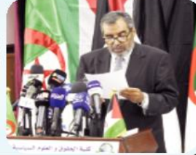
الوزير الأول الصحراوي يؤكد من ولاية بومرداس

■ افتتاح أشغال الجامعة الصيفية لإطارات جبهة البوليساريو والدولة الصحراوية