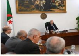
ترأس رئيس الجمهورية السيد عبد المجيد تبون ظهر أمس الأربعاء بمقر رئاسة الجمهورية مراسم تنصيب المجلس الأعلى لضبط الواردات.