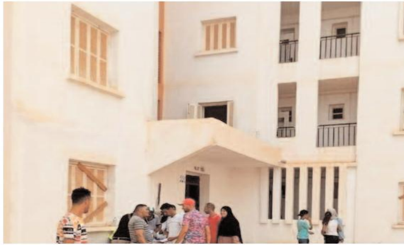
الكـرمـة و153 بـيـوتـلـيـس في صيغة الترقوي المدعم بالـإضـافـة إلى 320 وـحـدة سـكـنـية بـتـر الجـير وأرزيو وعين التـرك.

شرعت مصالح ديوان الترقية والتسيير العقاري لوهـران في تسليم مفاتيح 1.300 مسكن عمومي إيجاري لمستفيديها بالمحقن ببلدية أرزيو، حسبما استفيد من ذات الهيئة.