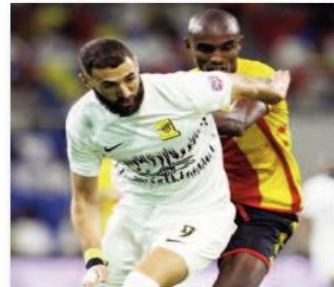
أسمر ضباب النجم البرتغالي كريستيانو رونالدو، مهاجم النصر السعودي، عن التشكيل المثالي

للجولة الثانية في مرحلة المجموعات بطولة كأس الملك لسلطانة العربية الأبطال. وبحسب موقع "sofa score" المتخصص في الإحصائيات، فإن التشكيل المثالي للجولة العربية غاب عنه كريستيانو رونالدو رغم تسجيله هدفاً في مرعى الاتحاد للتستيري التونسي، وتسببه في هدف آخر خلال المباراة التي انتهت بانتصار العملي (1-4). وغاب رونالدو عن التشكيل المثالي للجولة الأولى أيضاً بعدما تعادل النصر مع الشباب سلبياً. وتصدر التشكيل المثالي النجم الفرنسي كريم بنزما مهاجم الاتحاد السعودي بعدما سجل هدفاً في مرعى الصفاقسي التونسي، ليتواجد للجولة الثانية على التوالي. وتواجد أيضاً الكرواتي مارسيلو بروزوفيتش نجم وسط النصر السعودي في التشكيلة العربية. وحصل النجم البرازيلي أندرسون تاليسكا صانع