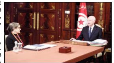
قرر رئيس التونسي قيس سعيد، مساء أول أمس الثلاثاء، إنهاء مهام رئيسة الحكومة

نجلاء بودن رمضان وتعيين أحمد الخشناني خلفا لها، بحسب ما أفادت وكالة الأنباء التونسية. وأوضحت الوكالة أن رئيس الحكومة الجديد، أدى اليمين أمام رئيس الجمهورية بقصر قرطاج. وأضافت أن الرئيس قيس سعيد تمتى لحشاني، "التوفيق له في هذه المسؤولية التي سيتحملها في هذا الظرف بالذات". وقال الرئيس التونسي "هنالك تحديات كبيرة لا بد أن نرفعها بعزيمة صلبة وإرادة قوية للحفاظ على