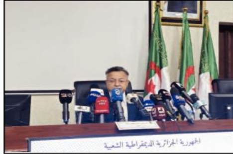
الجمهورية الجزائرية الديمقراطية الشعبية