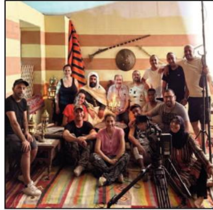
أنه وحسب الإنطباعات الأولية كان موقفا. وقد كان تصوير الفيلم الوثائقي الطويل الموسوم "السجناء الجزائريين في جزيرة سانت مارغوريت" للمخرج علي عيادي، إنتاج شركة "تالا فيليم" أو

وأبرز رياحي، أنه سلمه نفسه لروحانية الشخصية وطهرانيته ولقيمتها العظيمة، حيث كان مطلوبا منه أن يكون روحانيا إلى أقصى حد، وقام بمراقبة جسده جيدا بالمعرفة كي لا يشغل حركات لا تليق بوزن الشخصية النوعي، معتبرا