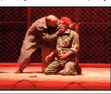
ويظهر أمام الجندي الفرنسي الخراس، درويش يعالج آلة خشبية بقطرته، وهو عمي خضر. الشيخ الزاهد الحكيم الذي لا ينقطع من لسانه الاستغفار والدعاء، وطلب العفو من الله. يتبع

ثانياً- تقطع العرض: - الانتحارية.. ظلام على الركح. ومعهم يسمع صوت ضابط فرنسي يصيح بلغة فرنسية في الجماهير المحتشدة: «مسعود! ماذا تريدون. vous est-ce que vous voulez Ecoutez» يجيبه بالعربية صوت جزائري بعيد من أعماق الشارع الشعبي: «الاستقلال!»، وهو مقطع خارجي مسجل، مأخوذة من الفيلم التاريخي معركة الجزائر. ليمنح فكرة عن سياسة رفض الشعب الجزائري لسياسة التحشيد التي كان يمارسها المستعمر الفرنسي من أجل مراقبة كل كبيرة وصغيرة في الأحياء والأرياف. لتبدأ سلسلة المشاهد المتبقية تباعاً. المشاهد الأول: يبدأ بانارة ضعيفة تتضح فيها تدريجياً، معالم الفضاء الركيحي، الذي يمثل مكان المحتشد، في قرية فلاحية بانسة، محاطاً من الخلف بسياج حديدي تتوسطه بوابة بدفتين، مغلقة على الدوام، ولا تفتتح إلا للكابيتان الفرنسي أو من له تصريح عبور، وتخضع البوابة لحراسة دائمة، وفي مقدمته أسلاك شائكة، وبين السياج والأسلاك تدور أحداث المسرحية التاريخية، وحية الأهالي داخل المحتشد المغلق. والمخروس والذي لا يخرج منه أحد إلا بتصريح «laissez passer» من السلطات العسكرية الحاكمة. ليظهر حارس فرنسي.. يقوم بتفقد وباحصاً أسماء الأهالي من ضمنهم المحتشد.