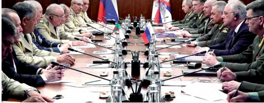
اجتمع في إطار البيع بالاجاز

روسيا مهتمة بتميز القدرات القتالية للقوات المسلحة الجزائرية