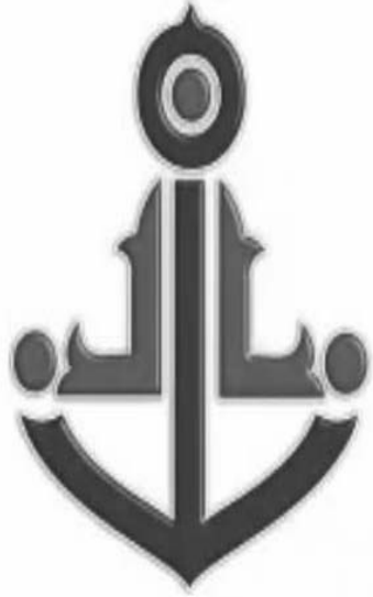
HYPROC SHIPPING COMPANY

هذا الأخير، الذي كان على وشك الرحيل، فإنه عكس ذلك قد قرر البقاء بمنصبه وراح أبعد من ذلك من خلال تنزيل بيان رسمي يوم الاثنين أين أكد فيه أنه يبقى لغاية إشعار آخر هو المسؤول الأول القانوني الوحيد على مستوى الشركة الرياضية لمولودية وهران وأنه معين بحكم قضائي، ما يعني أنه لا يستطيع أحد