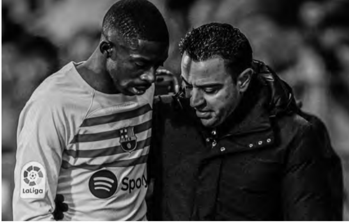
وضع باريس سان جيرمان مباي على رأس قائمة الراحلين هذا الصيف، مجاناً نهاية الموسم المقبل.

يستعد برشلونة من دون تردد لدخول حرب علنية مع باريس سان جيرمان، خلال الميركاتو الصيفي الجاري. وترددت أنباء قوية حول رغبة باريس، في ضم جناح برشلونة عثمان ديمبلي هذا الصيف، مستغلاً وجود شرط جزائي في عقده، بقيمة 50 مليون يورو، انتهى بند تفعيله أمس، وتتضاعف قيمته بداية من اليوم 1 أوت. وبعث باريس برسالة لبرشلونة، السبت، حيث طالبه بفتح باب التفاوض مع ديمبلي، لكن البارسا رفض بشكل قاطع، وشدد على أن مهاجمه ليس للبيع. ووفقاً لما ذكرته صحيفة "موندو ديبورتيفو" الإسبانية، "سيخوض