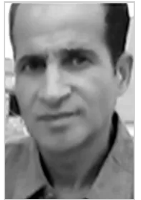
بقلم: جمال نصرالله

وضع الاعتبار طبعاً لبعض البديهيات عن أننا لا يجب أن نرى كل من يسأل طالما شاهدنا وسمعنا كثير من الأساتذة والدكاترة تبدو نواياهم غير حسنة، يوم يطرحون العديد من الأسئلة المفضرة، على شاكلة أحد المفكرين والذين وصل بهم الحد ليكتب لنا سؤالاً فيه الكثير من الامتعاض والتعالي بل من الحسرة ويخصص له فصلاً كاملاً في كتاب نشره وهو (لماذا توقف الوحي؟) أو إحدى الأدبيات التي كتبت لنا مسرحية بعنوان (الله يقدم استقالته)، وهي معروفة بخبراتها وانزلاقاتها تلك، التي لا تتفق مع العقل ولا النواميس الكونية. هذا النوع من الجرأة جعل الجميع في بوتقة واحدة، أي أن كل من يسأل أسئلة يُستشم فيها رائحة الدين وقد وجب تكفيره واتهامه بازدراء الدين الخفيف - وهذا عين الخطأ - إن طرح الأسئلة أو محاولة التنقيب عن حقائق الأشياء، أو قياسها بمقياس العقل والمنطق ليس بجريمة أبداً، ولن تكون حتى خطيئة أو شبهة، لأنه لو تدبرنا في قرأتنا الخفيف لوجدنا عشرات الدعاوى الخاصة بتحريك العقل وتشغيله بدلاً من جموده والتسليم بكل شيء وكذا التصديق المطلق، بحجة أن السلف كانوا هكذا؟ فكل ما هو بشري ومن صنعهم وجب وضعه تحت المجهر لأجل الكشف عن داء الأمة المستشري في العقول والنفوس، وما هو سماوي ورباني فلا مناص إلا من تجليله وتقديسه - وهكذا تؤخذ الأمور - وبين هذا وذاك ظل الإنسان العربي بالأمس واليوم عالقا بل مفصولاً، يعيش لآلاف التناقضات والازدادات في الشخصية