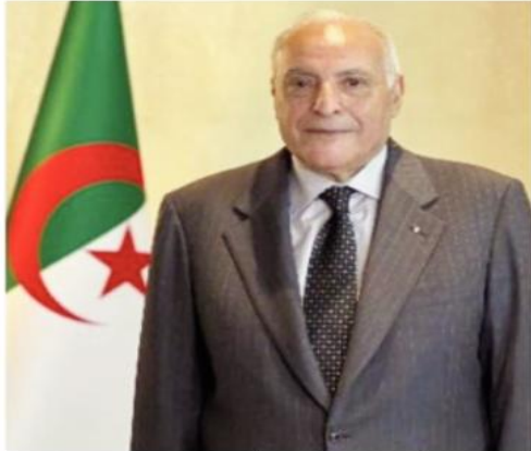
بين الشعوب والأمم؟ قائلاً، "إن التطرف في الإزمية التقيد ليجيب رئيس الدبلوماسية الجزائرية بحرية الرأي والتعبير تقيداً مطلقاً

وجدد وزير الخارجية إدانتها الشديدة لهذه الأفعال المقيتة والتصريحات المشينة ورفضه القاطع للمحاولات المتكررة لتبرير وتسويق هذه الاعتداءات الكراه عبر التذرع أو التحجج بحرية الرأي والتعبير. وتساءل الوزير عطاتي، "ما هي حرية الرأي والتعبير هذه التي يتوجب تقديسها، وهي التي تستعمل لاستفزاد مشاعر الآخر والإساءة إلى معتقداته والظعن في قيمه والاعتداء على أعلى مقدساته. وما هي حرية الرأي والتعبير هذه التي يطلب احترامها احتراماً لا يقبل أي استثناء، وهي التي يؤخذ منها ذريعة لإذاعة نثار الحقد والكراهة ولزرع بذور العنصرية والتمييز والاقصاء ونشر رسائل التصادم والصراع؟ وما هي حرية الرأي والتعبير هذه التي يفرض التمسك بها فرضاً وهي التي تفرق عوض أن تجمع وتثير البغض والغشينة في القلوب عوض أن تؤلف بينها وتدعو للتناهر والعداء عوض أن تخدم التعايش والتسامح والتفاهم