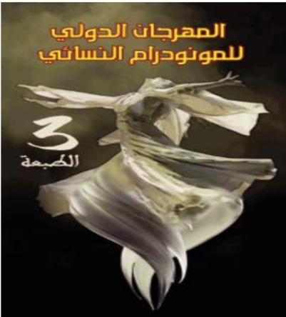
كل من فرقة بودركة للمسرح من الجزائر، وفرقة قصصه للمسرح من دولة تونس، وشركة دروب للانتاج والتوزيع الفني من تونس أيضا وجمعية الستار للإبداع المسرحي المنظمة للتظاهرة.

كشفت جمعية "الستار" للإبداع المسرحي بالوادي، عن ملامح الدورة الثالثة من المهرجان الدولي للمونودرام النسائي، المزمع عقدها في الفترة ما بين 6 إلى 10 نوفمبر المقبل بدار الثقافة محمد الأمين العمودي، والتي من المقرر أن تحمل اسم الفنانة القديرة "فاطمة حليلو"، وستحل دولة فلسطين ضيف شرف الدورة، أما جديد الدورة فيتمثل في مشاركة فرق أجنبية على شرف فرنسا والولايات المتحدة الأمريكية.