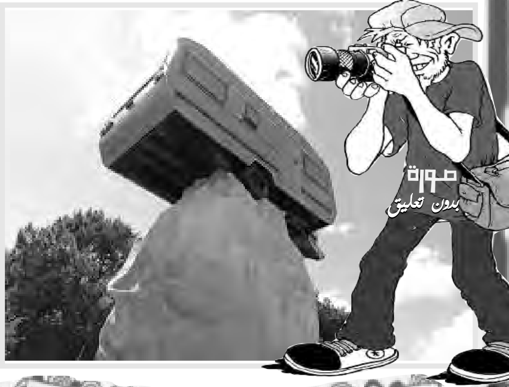
صورة بدون تعليق