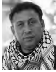
يقلم: سامي إبراهيم فودة

في حضرة القامات الشامخة جنرالات الصبر والصمود القابضين على الجمر والمتخذة قلاعها كالطود الشامخ، إنهم أسرانا البواسل الأبطال وأسيراتنا الماجدات القابضين في غياهب السجون وخلف زنازين الاحتلال الفاشم تنحني الهامات والرؤوس إجلالاً وإكباراً أمام عظمة صمودهم وتحمر الورود خجلاً من عظمة تضحياتهم، إخوتي الأماجد أخواتي الماجدات رفاق دربي الصامدين الصابرين الثابتين المتمرسين في قلاع الأسر، أعزائي القراء أحبتي الأفاضل فما أنا بصدده اليوم هو تسليط الضوء على رجال أشداء صابرين على الشدائد والبلاء، رسموا بأوجاعهم ومعاناتهم والألم طريق المجد والحرية واقفين وقوف أشجار الزيتون، شامخين سموخ جبال