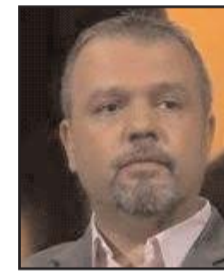
بقلم: خالدون الشيخ

وحتى عندما يعتقد المشجع ان هذا النادي او ذلك بات في خزينته 100 مليون يورو مثلاً من بيع لاعبين بهذه القيمة، فانه لا يدرك ان هذا الأمر غير صحيح مطلقاً، لأن 95 من الصفقات تنجز ويتم دفعها على أقساط مريحة، فاذا اتفق ناد على دفع 50 مليوناً لضم لاعب آخر، فان اجراءات المفاوضات والتي قد تمتد أياماً وربما أسابيع طويلة، ستمحور حول آلية تقسيط المبلغ، فأرسنال مثلاً وافق على دفع 105 ملايين جنيه استرليني الى وستهام لضم ديكلان رايس، لكن الاعلان الرسمي جاء بعدها بنحو 3 أسابيع، والسبب ان المفاوضات انهمكوا من الطرفين للاتفاق على آلية دفع هذا