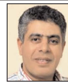
بقلم: عماد الدين حسين

وفي اليونان تم إغلاق العديد من المناطق السياحية خصوصاً الأكروبوليس. وطبقاً للخبراء فإن درجة الحرارة في هذا الوادي ستتجاوز أعلى درجة حرارة للجو تم قياسها بشكل موثوق فوق الأرض على الإطلاق.