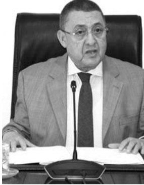
اللجنة تباشر دراسة التعويضات الخاصة بالمنتجات الزراعية والحيوانية

وقال الوزير لدا لقااه بأقارب الضحايا، بمنزل أخ الفقيدي، الواقع بالجزيرة جنوب-غرب بلدية تيزي وزو، إن "هذه المأساة لم تمس عائلتكم وحسب، بل كل الشعب الجزائري، ورئيس الجمهورية يتعاطف معكم في هذه المحنة من خلال هذه الالتفاتة الرمزية". واستطرد يقول أن "رئيس الجمهورية والحكومة متضامنين مع ضحايا هذه الحرائق، ونحن، هنا اليوم، للتعبير بصورة شخصية عن هذا التعاطف والتضامن". كما أعلن مراد أنه سيتقل، بعد تيزي وزو، إلى ولايات أخرى مستها الحرائق، موضعا أنه بدأ بتييزي وزو بسبب عدم انتهاء عملية التعرف على هوية الضحايا ببجاية التي شهدت عدة ضحايا آخرين، وأكد أنه سينتقل إليها في الأيام المقبلة. أما بخصوص تعويض الضحايا على الأضرار المادية التي تعرضوا لها، فقد أشار الوزير إلى إنشاء لجان لإحصاء الأضرار الناجمة عن هذه الحرائق بهدف تقديم التعويضات الضرورية، مذكرا بتضامن الدولة مع ضحايا الكوارث. كما أشاد، في هذا الصدد، بتضامن الشعب الجزائري في مثل هذه الأوضاع. وفي تصريح للصحافة على هامش زيارته، أكد الوزير أن التنظيم الاستباقي المتبع في مجال تسيير الحرائق قد سمح بالحد من الأضرار، مضيفا أنه مع استمرار الاحتباس الحراري واحتمالية نشوب حرائق أخرى، يجب تكييف تنظيم عمليات إخماد الحرائق مع هذه الظروف