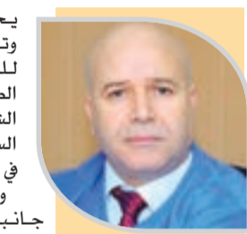
● عرار: مشاهد مروعة استدعت تكفلا نفسيا عاجلا بالأطفال

يحتاجون إلى دعم وتكفل نفسي وسند للخروج من هذه الصدمة تحاول الشبكة مساعدة السلطات الرسمية في تفريرها. ونقل عرار جانبا من المشاهد المروعة وحالة الخوف والفرع التي تلازم الأطفال التي وقفت عليها فرق الشبكة عبر كل من ولاية جيجل وجاية والبيورة، محاولة إخراجهم من دائرة