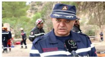
الشعبى نظرا لخصوصية المناطق

الجميلة». وكشف العقيد عاشور عن تسخير كل إمكانيات مكافحة حرائق الغابات وتجنيد ما لا يقل عن 300 عون مدعومين بكل الوسائل الضرورية. مع تأكيد دأ حريقا واحدا لا يزال ناشيا في ولاية سكيبكدة إلا أنه جار التحكم فيه، مطمئنا أنه لا يشكل أي خطر وتمثل فرق الإنقاذ على إخمادها.