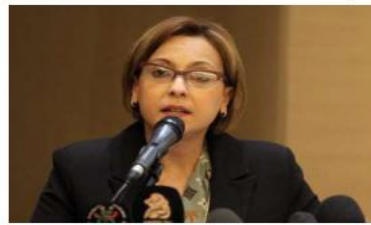
عملية الرقمنة التي يشارها