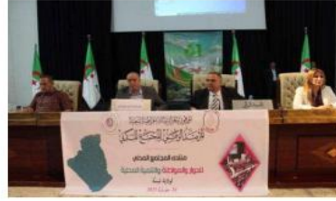
على افتتاح التعلالية جمعية رئيس المرصد الوطني للمجتمع المدني السيد نورالدين

احتضنت قاعة المحاضرات الكبرى بجامعة الشهيد الشيخ العربي التبسي بعاصمة ولاية تبسة اشغال منتدى المجتمع المدني للحوار والمواطنة والتنمية المحلية المنظم من طرف المرصد الوطني للمجتمع المدني بالتنسيق مع ولاية تبسة. اشرف السيد خليل سعيد