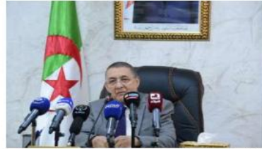
مجال مجابهة الحرائق

بحث سبل تعزيز التعاون الجزائري - التونسي في مجال مجابهة الحرائق