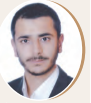
بقلم: إبراهيم أبو عواد ص 8