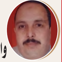
بقلم: سراي مسعود ص 9

ضمن الاستراتيجية الإسرائيلية في إفريقيا كيف نتعامل مع المغرب باعتباره قاعدة تنصت؟