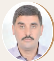
بقلم: عبد الكريم العراجي ص 9

ضمن الاستراتيجية الإسرائيلية في إفريقيا كيف نتعامل مع المغرب باعتباره قاعدة تنصت؟