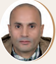
بقلم: سمير خلف الله ص 8

المدرسة الجزائرية والعملية التربوية إلى أين؟