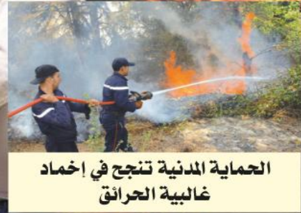
الحماية المدنية تنجح في إخماد غالبية الحرائق