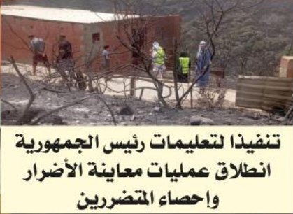
تنفيذا لتعليمات رئيس الجمهورية انطلاق عمليات معاينة الأضرار واحصاء المتضررين