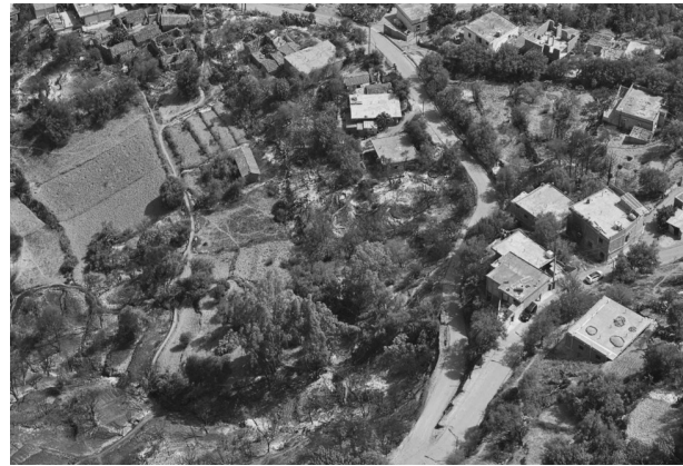
حاليا، على مستوى 13 بويرة حريق، موزعة عبر 7 ولايات،

بالموازاة، و تنفيذًا لتعليمات رئيس الجمهورية، باشرت السلطات المحلية بالمناطق التي تم على مستواها التحكم في الحرائق، عمليات معاينة الأضرار، وإحصاء المتضررين، قصد المضي في إجراءات تعويضها حسب ذات البيان .