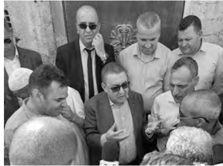
المحلية باشرت عملها.. وفي ولاية بجاية، تفقد السيد مراد عمليات الإخماد للبؤر المتبقية، لاسيما من خلال الطلعات الجوية لطائرات الإطفاء المجددة. وبذات الولاية، أكد على ضرورة وخلال استماعه لانشغالات

عابن وزير الداخلية والجماعات المحلية والتهيئة العمرانية، السيد إبراهيم مراد، أمس، المناطق المتضررة من الحرائق على مستوى ولايتي البويرة وبجاية، واطلع على تقدم عمليات الإخماد ومدى التكفل بالمواطنين المتضررين حسبما أفادته به الوزارة، ويأول محطة، اطلع وزير الداخلية، الذي كان مرافقا بالمدير العام للصحة المدنية، العقيد بوعلام بوغلاف، ببلدية الزبير بولاية البويرة على مستوى تقدم العمليات وظروف عمل أعوان الحماية المدنية ومدى التكفل بالمواطنين، حيث أكد لهم أن رئيس الجمهورية، السيد عبد المجيد تبون، يحرص على التواجد الميداني إلى جانب المواطنين سيما في الظروف الصعبة.