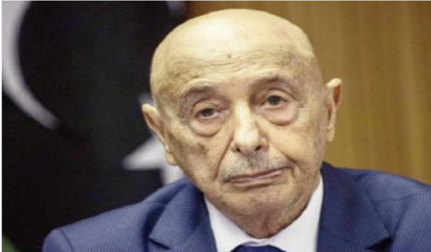
مصدر بوزارة الدفاع الفرنسية:

اعتمد مجلس النواب الليبي، الثلاثاء، خارطة طريق للانتخابات الرئاسية والبرلمانية المرتقبة في البلاد، تنص على فتح باب الترشح لرئاسة حكومة موحدة تشرف على العملية الانتخابية. وجاء إقرار خارطة الطريق وفق ما أعلن رئيس مجلس النواب عقيلة صالح، في ختام جلسة رسمية عقدها المجلس في مقره بمدينة بنغازي شرقي البلاد الثلاثاء.