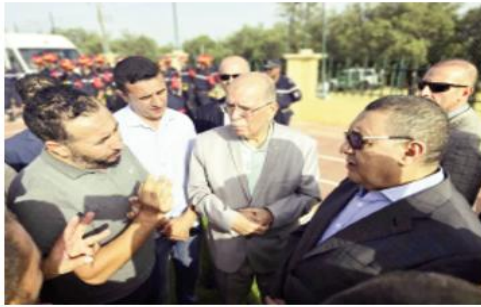
وكذا أهمية التنسيق وتعاقد الجهود بين جميع الفاعلين إلى غاية إخمادها، وكذا معاينة حجم الخسائر المسجلة. العمليات للمديرية العامة للحماية المدنية.

وفي هذا الصدد، أكد على ضرورة المتابعة الحثيثة لتطور الوضعية وأهمية التنسيق وتعاقد الجهود بين جميع الفاعلين إلى غاية الإخماد النهائي لكل الحرائق. كما أثنى على شجاعة أعوان الحماية المدنية الجيوش في مواجهة الحرائق، وفق ذات المصدر.