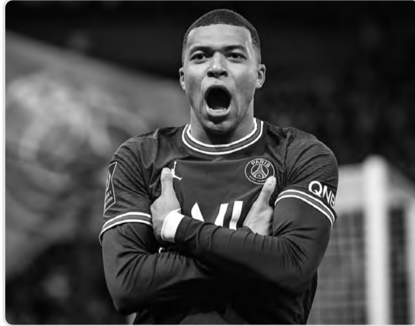
جدير بالذكر أن اللاعب البالغ من العمر 24 عاماً يغيب عن جولة "بي إس جي" الصيفية في اليابان وكوريا الجنوبية بقرار من ناصر الخليفي، رئيس النادي، لحين الفصل في مصيره.

كشفت تقارير صحفية إسبانية أن الدولي كيليان مبابي، مهاجم باريس سان جيرمان الفرنسي، قد رفض العرض الضخم المقدم من نادي الهلال السعودي، خلال الميركاتو الصيفي الحالي. وكانت تقارير قد أكدت تقديم النادي السعودي عرضاً رسمياً إلى النادي الباريسي من أجل بدء مفاوضات التعاقد مع مبابي، إذ وصلت قيمة العرض إلى 300 مليون يورو، مع راتب ضخم يبلغ 700 مليون يورو في موسم واحد. وأكدت صحيفة "ريليفو" الإسبانية، أن الفرنسي يفضل الجلوس على مقاعد البدلاء طوال الموسم مع سان جيرمان بدلاً من التوقيع مع الهلال السعودي. وأضافت الصحيفة الإسبانية، أن نجم الديوك مستعد لتحمل كل العواقب، في قراره بالبقاء في باريس حتى عام 2024، وعدم الرحيل لمسابقة الدوري السعودي، كما أشيع في كافة وسائل الإعلام العالمية. ومن جهة أخرى، لم يفوت مبابي فرصة السخرية من شائعات انتقاله للنادي السعودي، من خلال التفاعل مع نجم كرة السلة اليوناني يانيس أنتيتو كوتسيو، الذي نشر عبر حسابه الرسمي على "تويتر": "نادي الهلال.. يمكنكم التعاقد معي، فأنا أشبه مبابي كثيراً". ليتفاعل النجم الفرنسي مع رسالة نجم السلة اليوناني، وأعاد نشر التغريدة مصحوبة بـ 13 رمزاً ضاحكاً، تعبر عن سخريته من الشائعات الحالية.