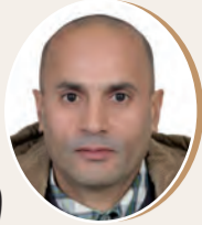
بقلم: سمير خلف الله ص 9

ذكرى وعبرة الأشهر الحرم مستهل الخير والبركات