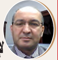
بقلم: مراد برغل ص 9