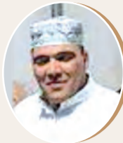
بقلم: محمد بن جابو ص 8

تحويلات وتعديات زمن التقنية الرقمية والذكاء الاصطناعي