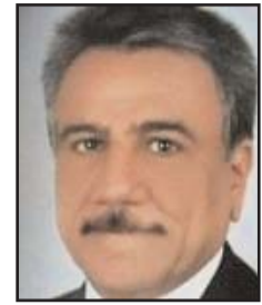
■ بقلم: مثنى عبد الله

قمة الهرم السياسي الروسي، ومؤيدة لهذه المواجهة بشكل أكبر، كما أن التهويل بالمعلومات الاستخباراتية ليس بالضرورة معناه أنهم قادرين على شق الصف الروسي، فعلى الرغم من كل الحملات الإعلامية الغربية لمحاولة دق أسفين بين الرأي العام الروسي وقيادته السياسية، فإنها لحد الآن فشلت. طبعاً هنالك خلافات داخل الجهاز الأمني والجهاز العسكري الروسي في ما يخص الحرب، لكن ليس هناك تأثير محسوس على الكيان السياسي الروسي.