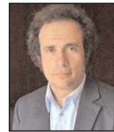
■ بقلم: عمرو حمزوي

الماضية من الاشتراكيين الديمقراطيين والمسيحيين الديمقراطيين، حيث أقر الاشتراكيون سياسات كالححد الأدنى للدخل وتغيير النظم الضريبية للحفاظ على دولة الرفاهية الاجتماعية والإبقاء على خدمات التعليم والرعاية الصحية المجانية بينما تبني المسيحيون الديمقراطيون سياسات الاندماج الأوروبي من العملة الموحدة إلى ضم الأعضاء الجدد في شرق ووسط القارة. في المقابل، لا تفعل الأحزاب الأخرى سوى الترويج تارة لمقولات الكراهية والخوف وثانية لمقولات فتح الأبواب للمهاجرين واللاجئين دون قيود وثالثة لمقولات عن البيئة والمساواة بين النساء والرجال بينما تتجاهل الفجوة الواسعة بين الأغنياء والفقراء داخل المجتمعات الأوروبية والفجوة الواسعة داخل الاتحاد بين الشمال الغني والجنوب الفقير.