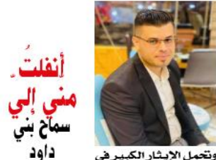
أنفلت مني إلي سماح بني داود

وتعمل الايثار الكبير في الانشغال بالآخر. وهذا الآخر هو عين المجموعة كلها، إذ تقول: "وهذا الشيء به يهيم على ضميرها الذاتي، المحصلة هي لا تقول أنا بل تستخدم الضمير (نحن)".