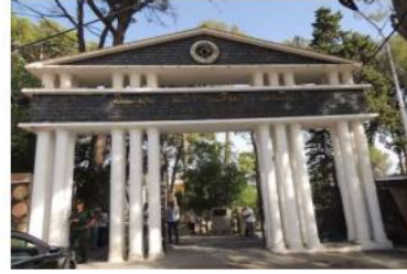
حيث أسدى الوالي تعليماته للقائمين على

تصنبا لانطلاق المهرجان الثقافي الدولي جميلة المزمع تنظيمه في شهور من العام الجاري قام والي ولاية سطيف السيد محمد أمين درامشي رفقة أعضاء اللجنة الأمنية والسلطات المحلية بزيارة تفقد للموقع الأثري بجميلة أين وقف على التحضيرات لجارية لتنظيم الطبعة 16 للمهرجان الثقافي الدولي جميلة.