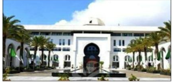
وجاء في البيان: «على إثر توالي حوادث الحرق والإساءة للمصحف الشريف في كل من كوبنهاغن وستوكهولم، استدعت وزارة الشؤون الخارجية والجمالية الوطنية بالخارج، اليوم، سفيرة الدانمارك لدى الجزائر وكذا القائم بأعمال سفارة السويد بالجزائر، لإبلاغهما احتجاج الجزائر الرسمي وإدانتها الشديدة

وهذه المسانحة، جدّدت الوزارة مطالبة الجزائر للسُلطات في البلدين، «بتخاذ كافة الإجراءات الضرورية لمنع تكرار هذه الأعمال التي ترفضها جميع الشرائع السماوية والقوانين والأعراف الدولية». كما تم «التشديد على أن هذه التصرفات المذمومة التي تصانفي وقيم السامح والتعايش، من شأنها أن تؤجج الكراهية وتعزّي العنصرية ضد المسلمين»، حسب ذات البيان.