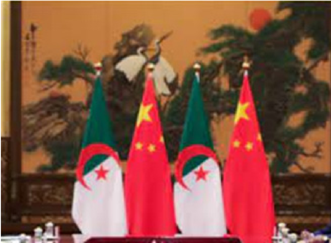
السيارة شرق- غرب و جامع الجزائر و النمذجية في الجزائر، مثل الطريق المبنى الجديد لمطار الجزائر العاصمة، الصينية في تنفيذ المشاريع

ومن نتائج الزيارة وفق السفارة، اتفاق الجانبين على الإسراع في تنفيذ نتائج القمة الصينية العربية الأولى، و تعزيز التعاون في إطار منتدى التعاون الصيني الإفريقي، و الدفع بإقامة المجتمع الصيني العربي و المجتمع الصيني الإفريقي للمستقبل المشترك في العصر الجديد.