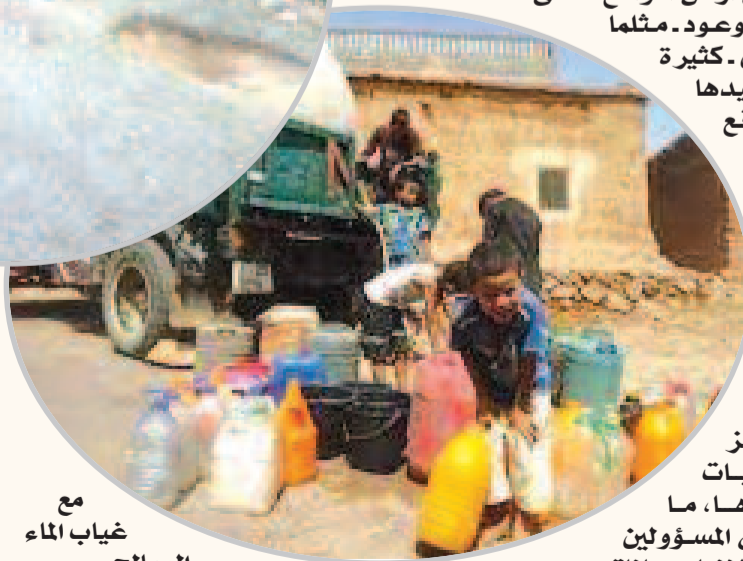
مع غياب الماء الصالح للشرب، فمعظم السكان -