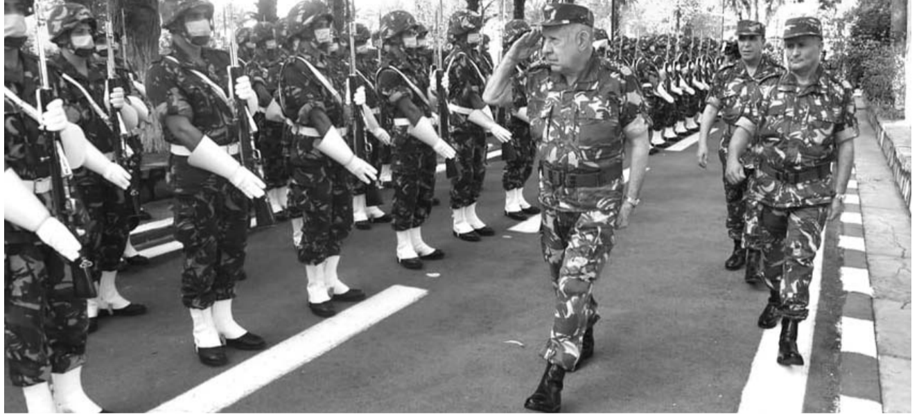
■ مليكة. ب

شدد الفريق أول شنقرية رئيس أركان الجيش الوطني الشعبي أن الجزائر تسير بخطى ثابتة نحو القمة، في مجالاتها الجيوسياسية الإقليمية والجهوية، مبرزا أهمية تماسك وانسجام وتضافر جهود جميع أبناء الوطن المخلصين.