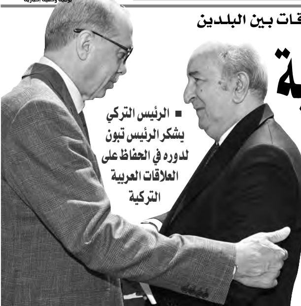
الرئيس التركي يشكر الرئيس تبون لدوره في الحفاظ على العلاقات العربية التركية

من جانب آخر، أكد المحللين أن الانضمام إلى منظمة "بريكس" مطلب اقتصادي تسبقه توافقات جزائرية صينية روسية جيو سياسية، كما أنه سيسهم للجزائر مستقبلا الاستفادة من الميزات التجارية والأنظمة المالية والتشديد العالية خلال السنوات المقبلة في ظل توفر إرادة قوية للجزائر في تعزيز قدراتها الطاقوية وتنوع تجاردها في أسواق أفريقيا والعالم. وكان رئيس الجمهورية قد كشف في وقت سابق عن إيداع طلب رسمي للانضمام إلى بنك "بريكس"، مؤكدا استعداد الجزائر لأن تكون مساهمها الأولى في هذا التكتل تعادل 1.5 مليار دولار، وذلك إلى جانب طلبها رسميا للانضمام بالجموعة.