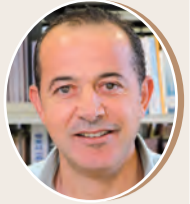
بقلم: زياد بني شمس 9 ص

التعبير الكتابي الإبداعي مهارات اتصال وتواصل