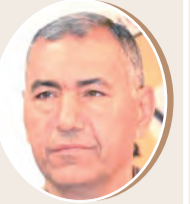
بقلم: عبد الناصر فروانة 9 ص