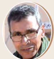
بقلم: حسان ميليد علي 8 ص

التعبير الكتابي الإبداعي مهارات اتصال وتواصل