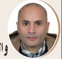
بقلم: سمير خلف الله 8 ص

المدرسة الجزائرية والعملية التربوية إلى أين؟