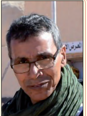
بقلم: حسان ميليد علي

ظهور النظام العالمي الجديد سيبدأ من تحديد علاقات دولية جديدة، ونزع فتيل صراعات وحروب وإعادة الحقوق إلى أهلها. لعل العولمة التي ظهرت مع هيمنة أحادية القطب، سنة 1991.