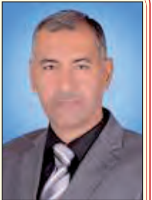
الكاتب: عبد الناصر عوني فروانة

.. رائعة في جمالها وطبيعتها وشواطئها، وفاتنة بكسوتها الخضراء. هائلة بأثارها العديدة ومدنها التاريخية العظيمة. الجزائر.. متميزة بمتحفها "مقام الشهيد"، وشامخة كجبالها وعظيمة بثورتها وحجم تضحياتها. الجزائر..