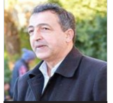
بقلم / معمر حبار

ومهلك، ولا ينصح به. وكل عيب بمفتاح الحضارة هو عيب بالحضارة، وماضيها، وحاضرها، ومستقبلها، ونسب الحضارة عمرها عمر الأرض، وحرقت لمجهودات واجتهادات أجيال أفنت ليلها، ونهارها في سبيل الحضارة التي بين يديك. لا يمنح مفتاح السيارة إلا لمن تعلم قواعد السيادة، وكان مسؤولاً عن تصرفاته، ومدركاً لعواقبها. وكذلك يمنح مفتاح الحضارة للعاقل، والمدرك، والمؤهل، والواعي، والمميز، والمبدع، والمنتج، والقوي، والعزيز، والذي يعتز ويفتخر بما يملك من حضارة فاعلة. يحتاج مفتاح السيارة لتأهيل، وتدريب، ووقت، وجهد، وعرق، وتحمل. ومفتاح الحضارة يحتاج لوقت طويل، وجهد شاق، وعمل دائم، وسهر مستمر، وبذل العزيم من المال، والنفس، والوقت. يحتاج مفتاح السيارة لمدرّب صاحب خبرة، وصبر، ومهارة. ويحتاج مفتاح الحضارة لأمة تتدرّب على أمة أسبق منها في الحضارة، وأدرى في انتظار