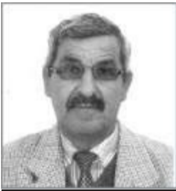
بقلم / قدوده مبارك

وحينها لن يجد العملاء المنبطحين ولا فاقد الضمير شيئا .