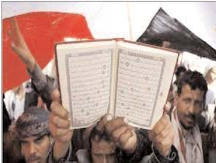
بإهانة مقدساتنا، لبيان المخاطر والآثار والاقتصادية والسياسية للتعريف بالإسلام واتخاذ ذلك هدفاً استراتيجياً للدول الناجمة عنها".

والخميس، أقدم المدعو سلوان موميكا على تمزيق نسخة من القرآن والعلم العراقي أمام سفارة بغداد لدى السويد، في واقعة هي الثانية للشخص نفسه بعد الأولى وأخر جوان الماضي، عقب سماح السلطات السويدية له باستهداف مقدسات المسلمين.