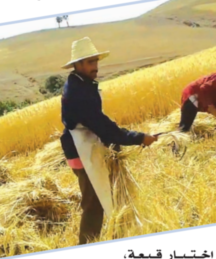
اختيار قبعة، وتذكر هذه النصائح.

ولكن إذا كنت ترتدي قبعتك بشكل فضفاض فسوف تسمح للهواء بالانتشار وتساعد في الحفاظ على برودة جسمك، لذا إذا كنت تريد التقلب على الحرارة هذا الصيف فضع في اعتبارك هذه النصائح عند ارتداء قبعة الشمس فلا فوراً لوجهك وأذنيك ورقبتك وتحافظ عليها باردة، ارتداء قبعة التبريد، وهي شكل جديد نسبياً من الحماية من أشعة الشمس، طريقة رائعة للتقلب على حرارة الصيف.