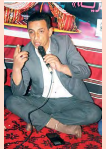
بقلم: مبروك زرواي / الجلفة

يا دنيا قدام فيك العبد يحير ! ويشوف اللي كان بكري يسمع بيه ! يا دنيا وعلاه مرك هاك يدبر ؟ ذبتلي عرف الحق عوضن تحببني ! يا دنيا وعلاه فيها هاك يصير ؟ وشمن محنة طايحة ذا القلب عليه ؟ فارقيتها بمها ؟ والعبد يشير قدام مو . لا بعد الحزن بيتيه ياك فراق الوالدين يكون ذكير ... ... موسم ما يحفاش ليّام تسنّيه من فرقتهم كل صبر وعقل يطير يا ويح اللي عاش من بعد مواليه اللي جات تحبب ليّام التفكير واللي جات تفكرو واش ينسبه ؟ ولي العشق اللي ضربها كان كبير ؟ والعبد هبلو فراق اللي يشيته فصو خبل غرامها بزواج الغير ويبقى حبل أحلامها تتجفّ بيه ولي بيك سحور نفضات لكير ؟ حسدوك على ما من الزين ملكيته والغيرة تعمي العين نهار تغير والعين اللي صابتي لازم تديه .