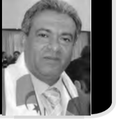
تقرير: علي سمودي - جنين - القدس