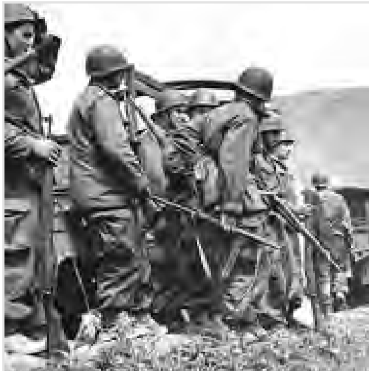
مهمات أكثر صعوبة ولكن غير مستحيلة

كانت مهمة هذا المجاهد السابق بصفته ضابط اتصال تفرض عليه الانتقال بين مراكز قيادة الولايتين التاريخيتين الثالثة والرابعة، وفي خضم