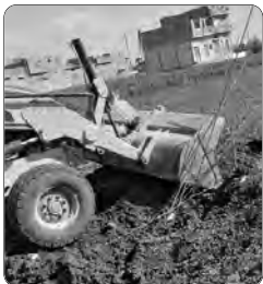
مساعدات الدولة، إلى جانب تنوع العرض بخصوص السكن، من إطار الاستفادة من السكن الاجتماعي، مثلما أوضح من جهته مدير السكن على دجربال.

وحتى منع إلى غاية الآن، ما مجموعه 21 ألف قطعة أرضية عبر الولاية، من بين حصة تضم 30 ألف قطعة أرضية، استفادت منها ولاية غرداية، منذ بدء العملية في ديسمبر 2015، وعرفت انقطاعات ذات صلة بعدم توفر مكاتب الدراسات والإنجاز المتخصصة، ويضاف إلى ذلك التقلبات المناخية والوضع الصحية التي كانت مرتبطة بجائحة كوفيد-19، مثلما تم شرحه. سيسمك إنجاز هذا البرنامج الطموح للسكن الفردي، من القضاء على أزمة السكن واستحداث عديد مناصب الشغل، لاسيما على مستوى قطاع البناء بالمنطقة. كما سيسمح بضمن تنمية منسجمة ومتوازنة للنسيج العمراني، تستجيب لمطالبات سكان ولاية غرداية، خصوصا على صعيد السكن الفردي، وهي الصيغة المفضلة لدى سكان مناطق الجنوب.