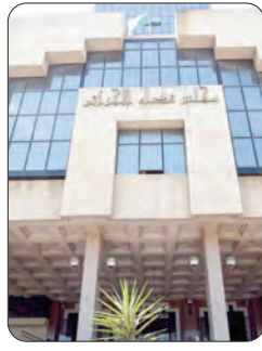
لموظفين عموميين ومعلومات تتعلق بملفات قضائية وتسريها إلى أشخاص لا صفة لهم في الإطلاح عليها بهدف عرقلة والتأثير على السير الحسن للإجراءات والإضرار بمصالح الدولة. وتابع أنه بعد استكمال التحقيق الابتدائي،